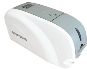
▲ 高品質 & 低価格カードプリンタ GRASYS ID170

また、磁気ストライプや非接触ICカード用の各エンコーダーを内蔵することができ、情報の書込み機能もご利用いただけます。