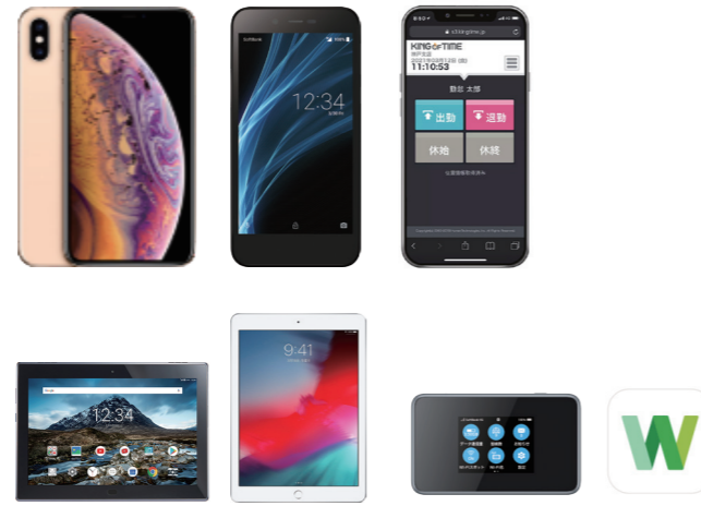
▲ 携帯電話だけでなく、お客様のニーズに合わせたご提案が可能