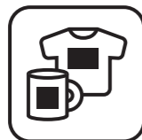
オリジナルグッズ