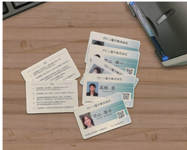
▲ 社員証・学生証・診察券など、様々な用途に対応