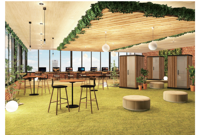
▲ オフィスに合わせて自由にデザイン可能。