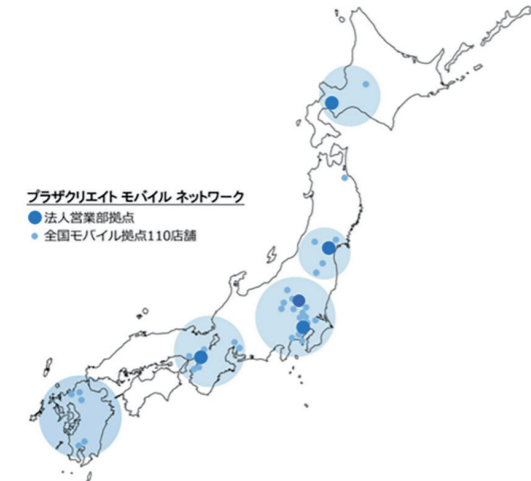
▲ 全国5か所の法人営業部拠点に加え、100店舗以上のモバイル店舗を運営