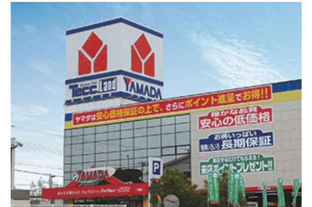
▲ 協業先例: ヤマダ電機様外観