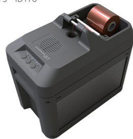
▲ インクリボンシュレッダー GRASYS BIT