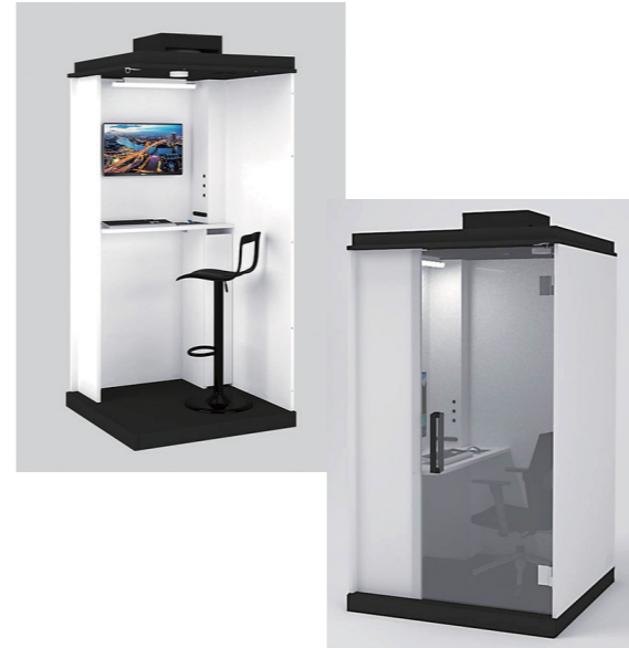
▲ 2サイズご用意。高機能+圧倒的低価格を実現